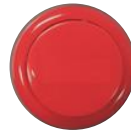
下車確認ボタン(赤)