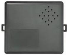
本体(コントロールボックス)