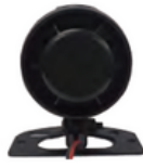
車外警報機 (ケーブル3m)